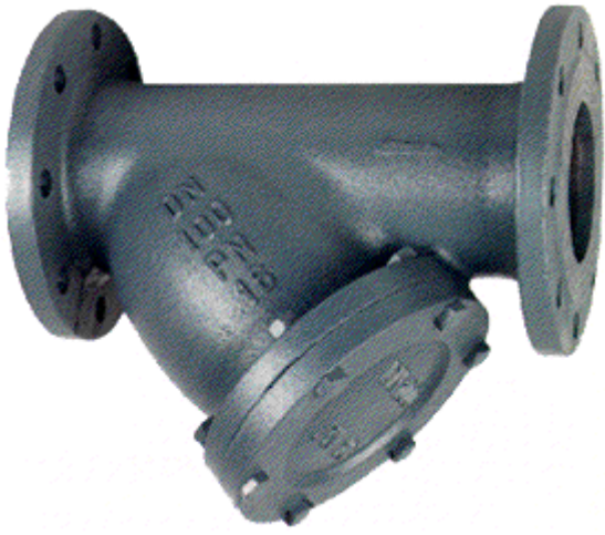
FIG. 3011 - FILTRO a "Y"